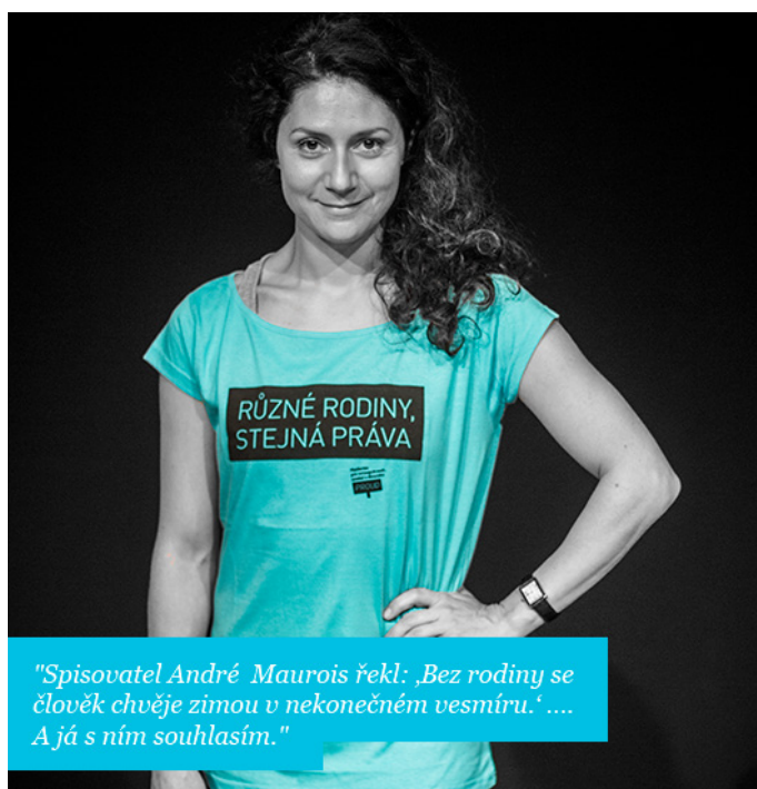
Kampaň Různé rodiny, stejná práva.