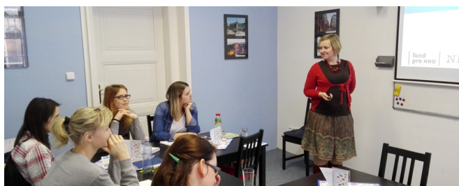
Duhové školení v Hradci Králové.