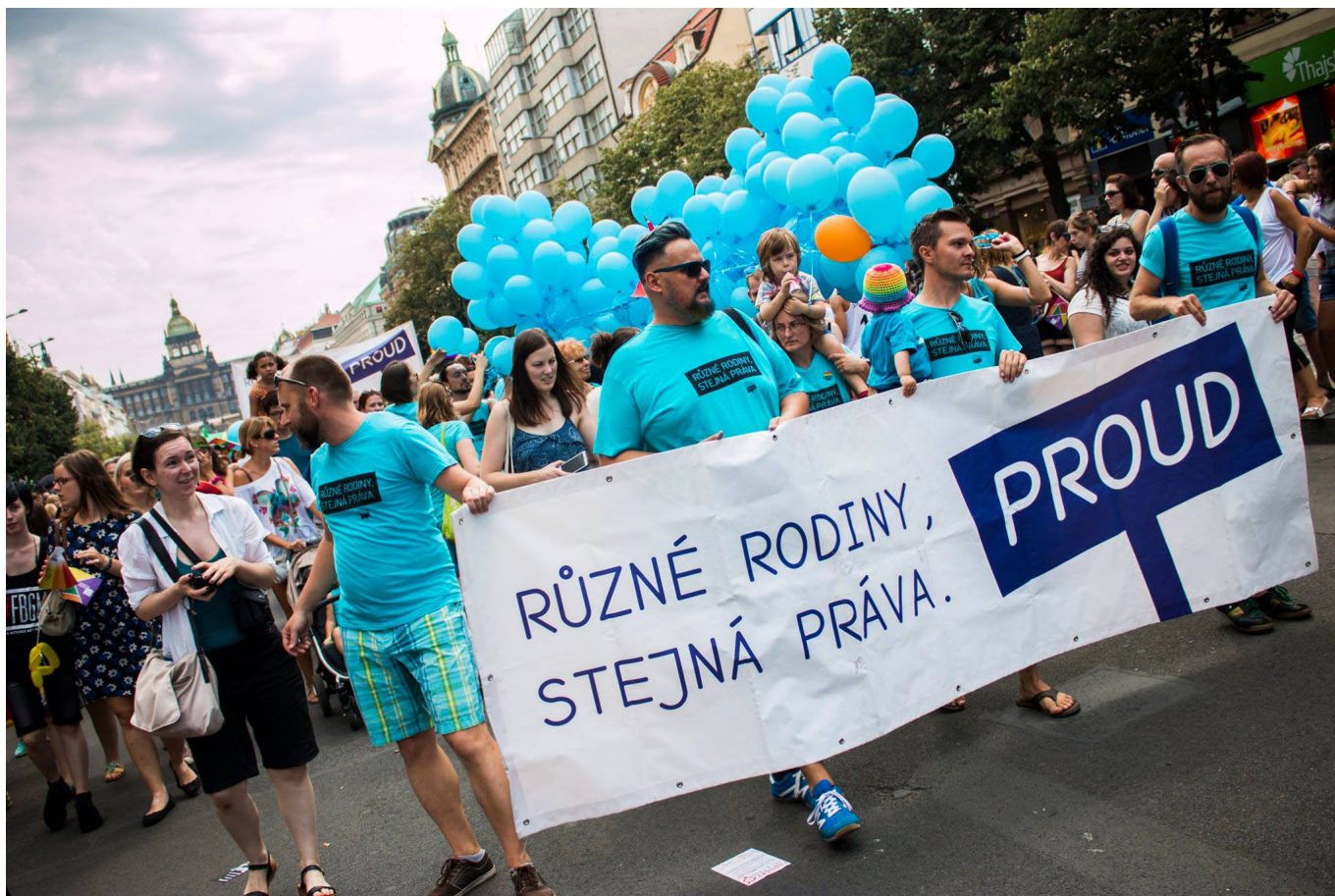
Kočárková jízda na Prague Pride 2015.