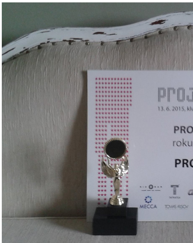
GayStar Projekt roku 2015.