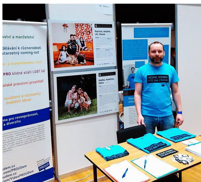
Náš stánek na NGO Marketu 2015.