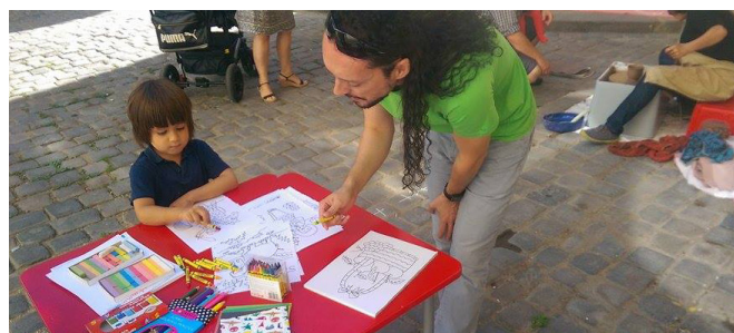
Zažít město jinak v Opatovické ulici.