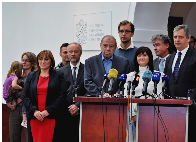
Tisková konference na podporu novely zákona o registrovaném partnerství.

byl předložen skupinou poslanců a poslankyň napříč politickým spektrem již v srpnu 2014. Předložením začal legislativní proces projednávání v parlamentu. Dlouho se nic nedělo a na podzim 2015 se rozhodl ministr pro lidská práva Jiří Dientsbier zasáhnout do situace a předložit návrh jako návrh vládní. V červnu 2015 valná hromada členů organizace přijala strategický plán pro roky 2015 – 2020, kde jsme si stanovili další cíle v oblasti advokacie a lobbyingu. Pro účely advokacie budeme pokračovat v rozšíření seznamu našich podporovatelů, mezi novináři, poslanci a osobnostmi z veřejného života. Součástí našich aktivit je kampaň „Různé rodiny, stejná práva“. Oslovili jsme řadu známých osobností, aby se do kampaně zapojili. Vznikla tak série fotografií, kde jednotlivé známé osobnosti, ať už se světa showbyznysu, ekonomiky nebo politiky, sdělují, proč tuto novelu zákona podporují.