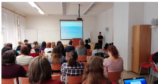
Duhové školení v Českých Budějovicích.

V rámci spolupráce s organizací Jules a Jim se naše organizace začala více věnovat tkz. Duhové prevenci, předcházení homofobní šikany. Bylo vybráno a vyškoleno 15 budoucích lektorů. A do března 2015 proběhlo několik pilotních seminářů na školách ZŠ a SŠ a gymnáziích. A v novém školním roce od září do prosince 2015 bylo zrealizováno 15 seminářů Duhové prevence.