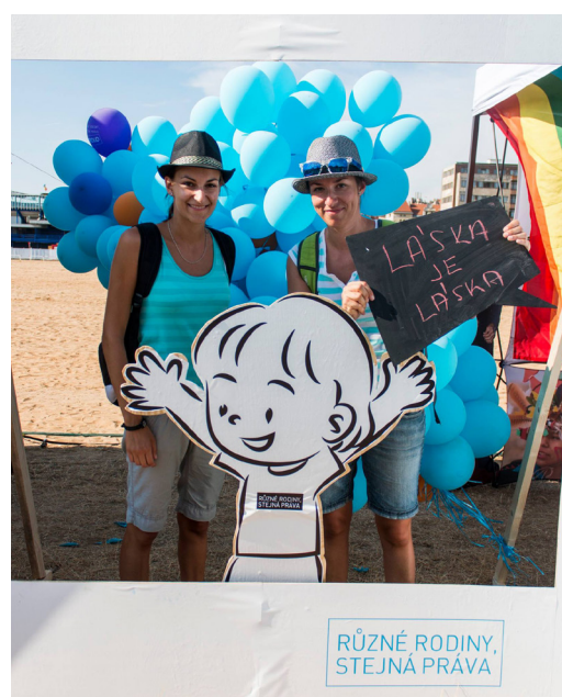
Stánek PROUDu na Letné během Prague Pride 2015.

PROUD také pokračoval ve své tradici a vyrazil do průvodu v tyrkysových barvách kampaně „Různé rodiny, stejná práva“ s Kočárkovou jízdou. Rok od roku se k jízdě připojuje více našich fanoušků. Letos jsme přímo v průvodu poskytli několik rozhovorů o aktuální situaci a nečinnosti našich poslanců, kteří se novelou zákona o registrovaném partnerství a rodičovství stejnopohlavních párů nezabývají. Na Letné se program organizace nesl v duchu focení v našem fotostánku, mnozí z návštěvníků se připojili ke známým osobnostem, jež nás navštívily a nechaly se s námi vyfotografovat.